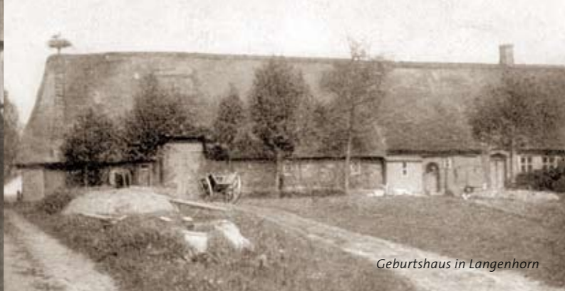
Geburtshaus in Langenhorn